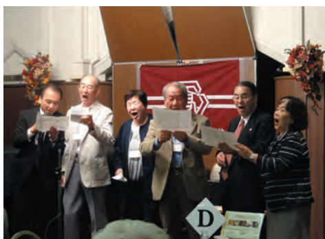
校歌・校友歌斉唱

2016年10月1日(土)に音楽ビヤ プラザ「ライオン」銀座店で開催さ れた同窓会の様子をご覧ください。 貴重な講演や書道シンガーのパフォ ーマンスで盛り上がりました。