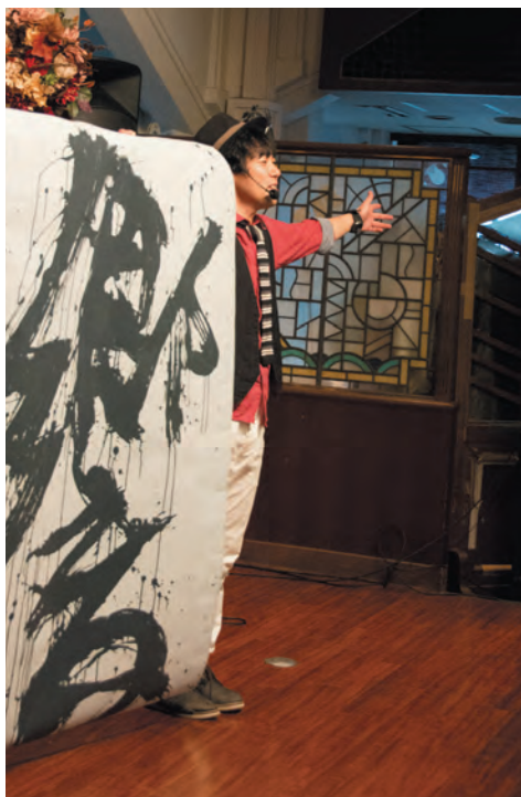
友近890のパフォーマンス