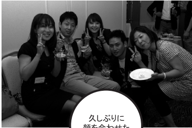
久しぶりに顔を合わせた同窓生と