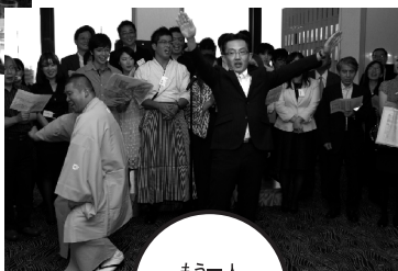
もう一人応援団出身見つけた!