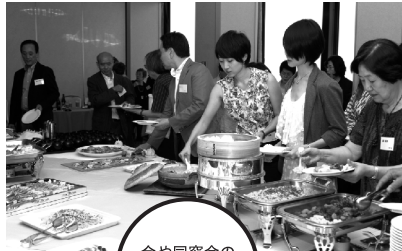
今や同窓会の名物となった鯛めし

2012年10月6日(土)13時30分から新宿三井クラブ(新宿三井ビル54F)で開催された同窓会。約100名のご参加をいただき、交流を深めました。