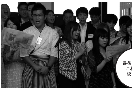
最後はやっばこれですよ校歌斉唱