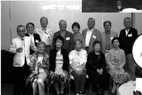
先輩方も元氣いっぱい