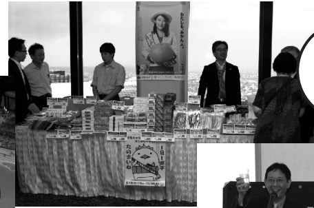
松山特産品の即売会も大人気