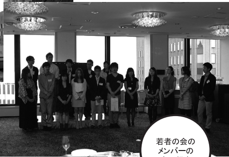
若者の会のメンバーの自己紹介